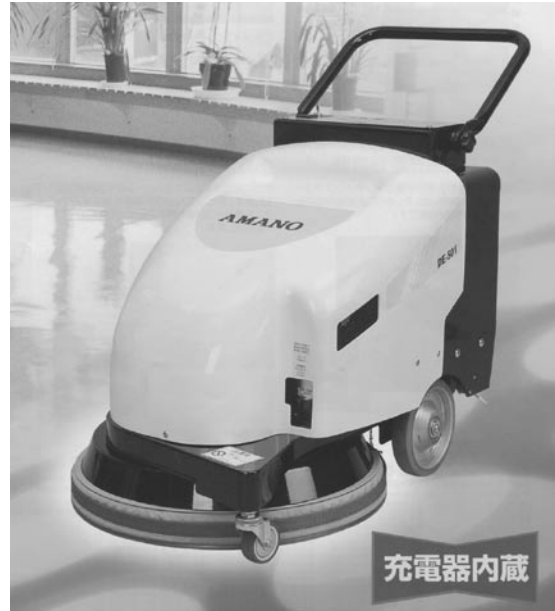
写真1 アmano (株) 殿 DE-501 型外観